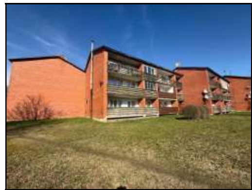
Skats uz daudzdzīvokļu dzīvojamo ēku