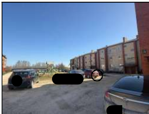
Skats uz daudzdzīvokļu dzīvojamās ēkas iekšpagalmu