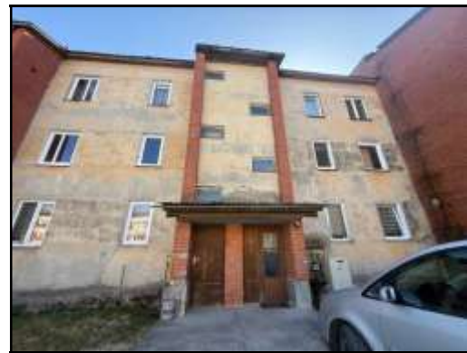
Skats uz kāpņutelpu