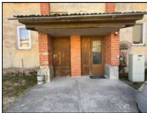
Skats uz kāpņutelpas ieejas durvīm