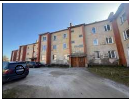
Skats uz daudzdzīvokļu dzīvojamās ēkas iekšpagalmu