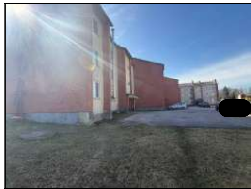
Skats uz daudzdzīvokļu dzīvojamās ēkas iekšpagalmu