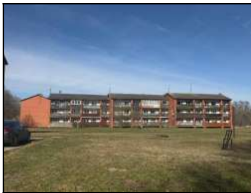
Skats uz daudzdzīvokļu dzīvojamo ēku