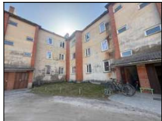
Skats uz daudzdzīvokļu dzīvojamās ēkas iekšpagalmu