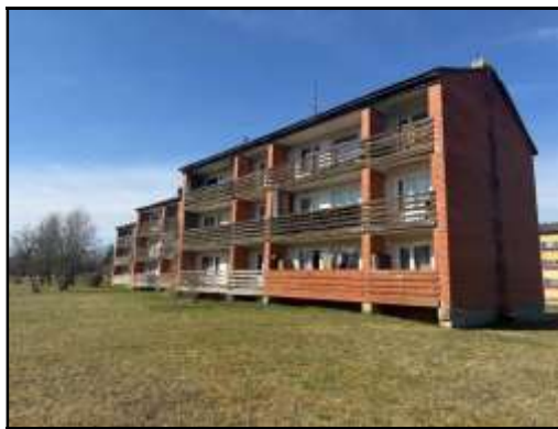
Skats uz daudzdzīvokļu dzīvojamo ēku